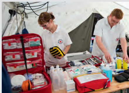
Der Sanitätsdienst ist auf vielen lokalen Veranstaltungen vertreten und leistet Erste Hilfe.

Wo viele Menschen zusammenkommen, sind oft die ehrenamtlichen Helfer des Rotkreuz-Sanitätsdienstes nicht weit. Egal, ob ein Straßenfest veranstaltet wird, sich Sportfreunde zum Marathon oder Fußballspiel treffen oder der nächste Faschingsumzug ansteht. In der Menschenmenge kann einem schnell mal schwarz vor Augen werden oder ein Sturz passieren. Die erfahrenen Helfer sind dann sofort zur Stelle, stabilisieren den Kreislauf und versorgen Verletzungen. Falls notwendig, koordinieren sie auch den Transport ins nächstgelegene Krankenhaus.